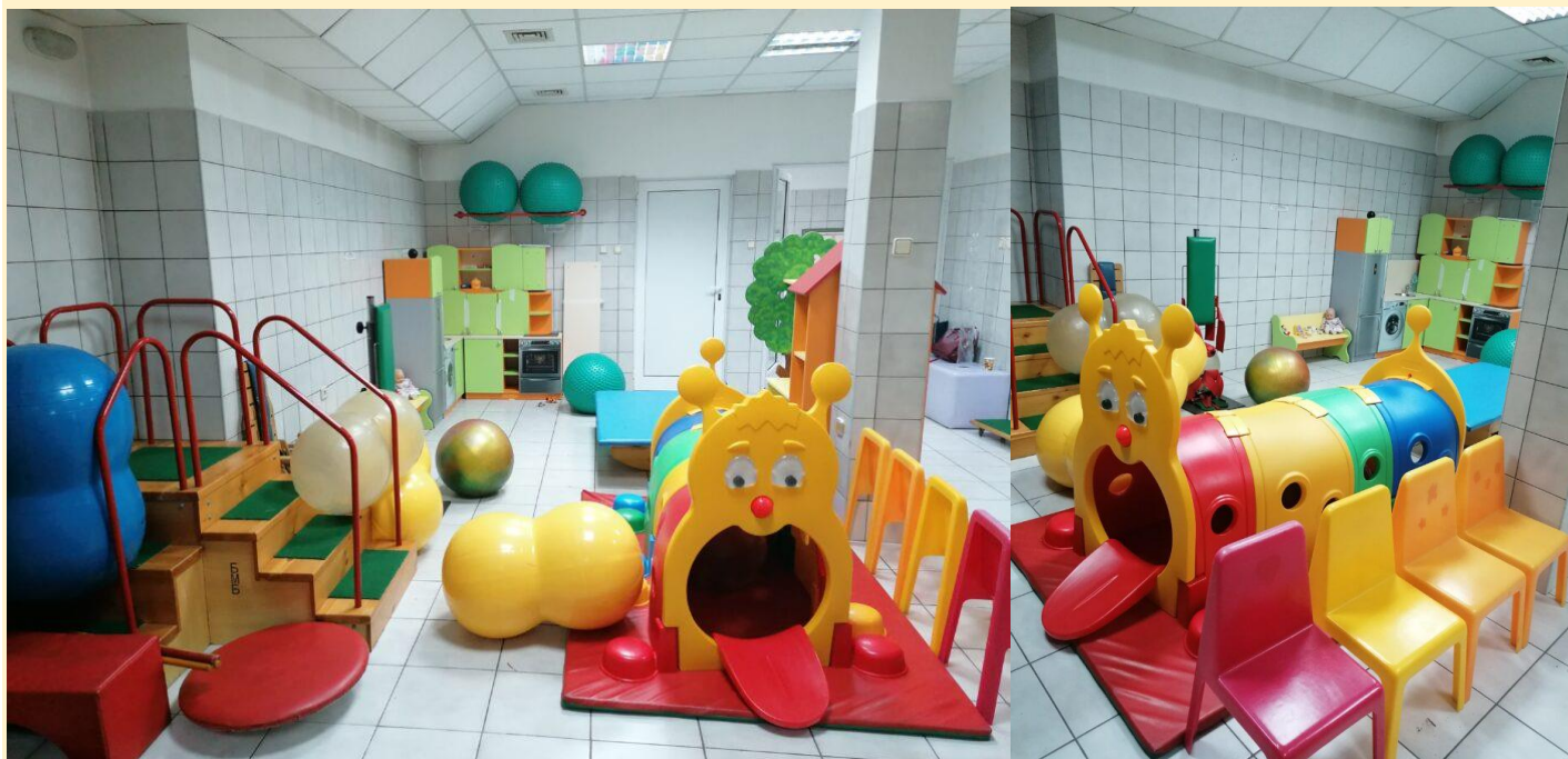
Терапевтична зала за работа с деца с аутизъм