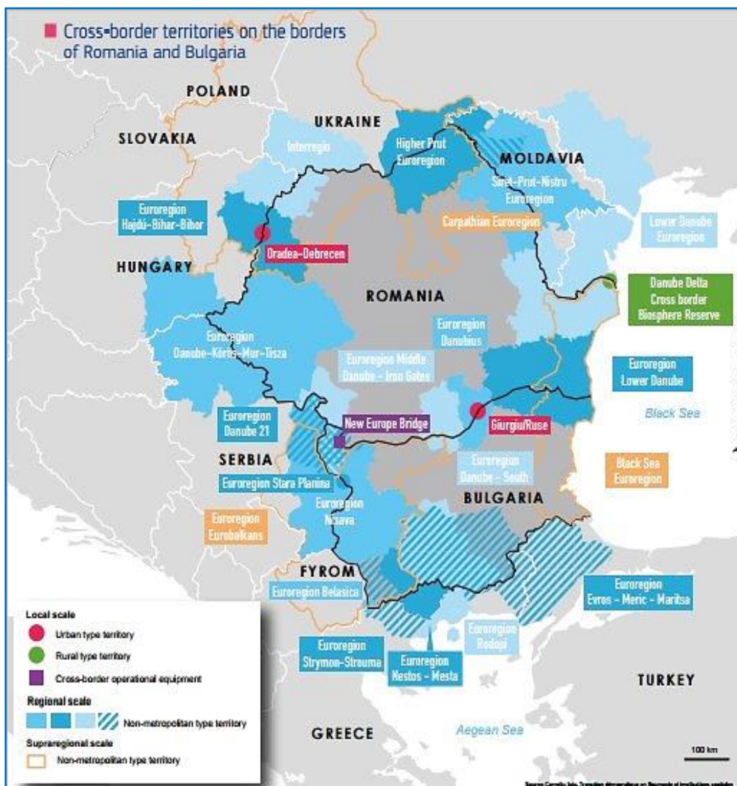
Карта 1. Еврорегионално сътрудничество Сърбия-Румъния-България.

Надяваме се настоящият дисертационен труд да има своя принос за осмислянето и запълването на една значима академична ниша с оглед легитимното утвърждаване и бъдеще на ЕС, която остава все още недостатъчно широко и в дълбочина изследвана.