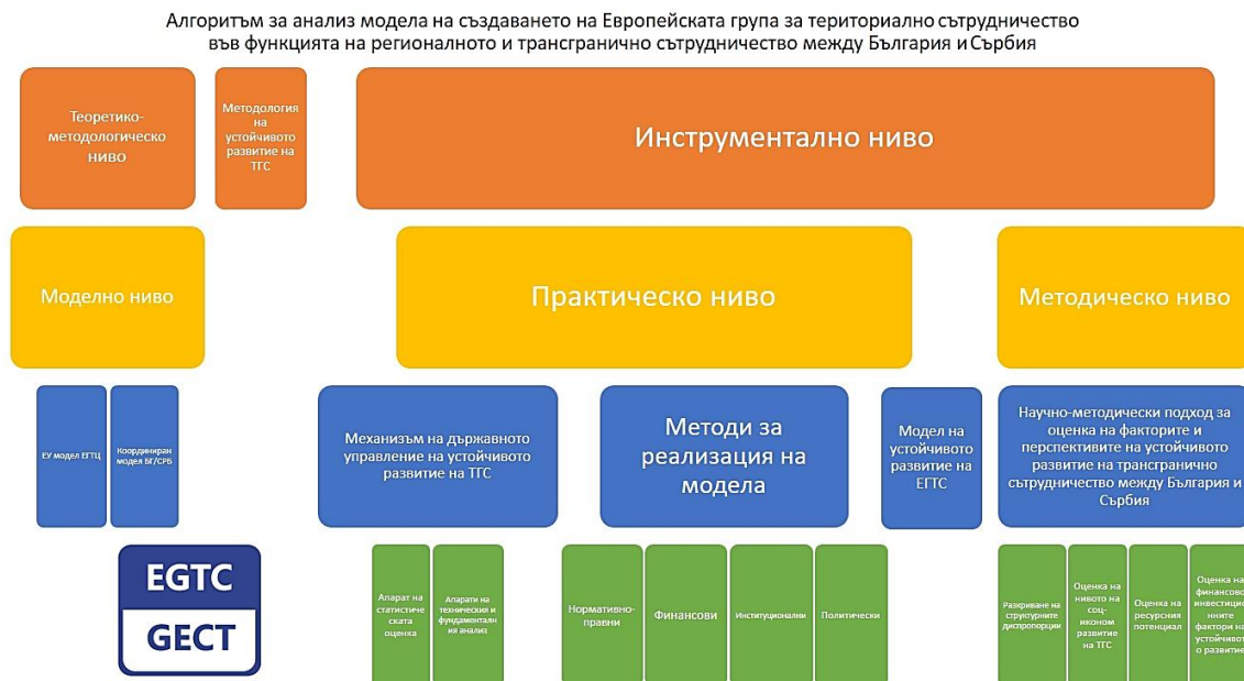
Фигура 1. Алгоритъм за анализ модела на създаването на Европейската група за териториално сътрудничество във функцията на регионалното и трансгранично сътрудничество между България и Сърбия

теоретически методи и модели, както и практически инструменти и мерки за реализация на държавната политика за управление на устойчивото развитие на ЕГТС.