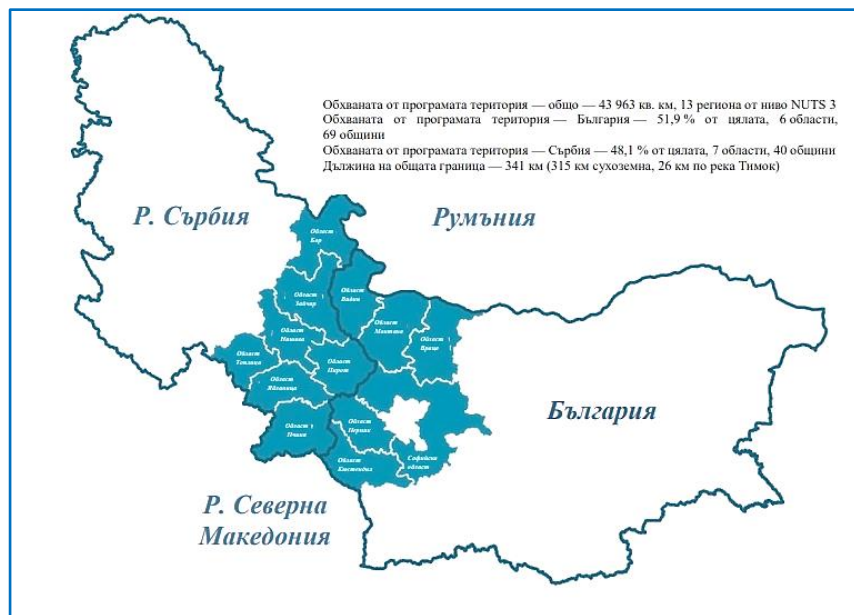
Карта 2. Трансграничен регион България-Сърбия.