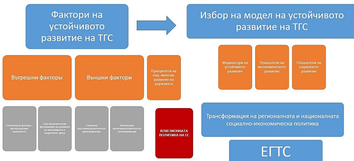
Фигура 2. Механизъм за управление на устойчивото развитие на ТГС и на създаването на Европейската група за териториално сътрудничество във функцията на регионалното и трансгранично сътрудничество между България и Сърбия

Механизъм за управление на устойчивото развитие на ТГС и на създаването на Европейската група за териториално сътрудничество във функцията на регионалното и трансгранично сътрудничество между България и Сърбия