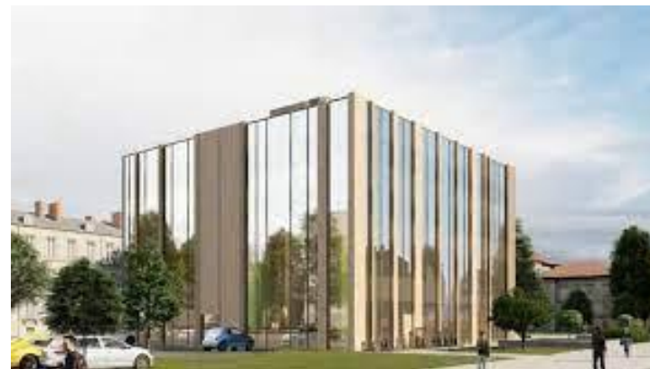
Сграда да GATE