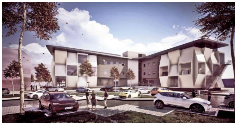
Сграда на ЦВП УНИТе

Снимки на новопостроените сгради на Центъра за върхови постижения УНИТе, Центъра за компетентност „Чисти технологии и кръгова икономика за устойчива околна среда“ и Института „Големи данни в полза на интелигентно общество“ (GATE, Новопостроените сгради са финансирани от оперативна програма „Наука и образование за интелигентен растеж“ по проекти: BG05M2OP001-1.001-0004, BG05M2OP001-1.003-0002, BG05M2OP001-1.002-0019