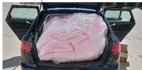
Фиг. 3 Четири хиляди парчета дунапрен