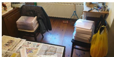
Фиг. 6 Готовите шлемове