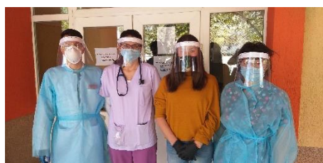
Фиг. 7 Лекарите от УМБАЛ "Св. Иван Рилски" получават дарението от вече серийно-произведените шлемове