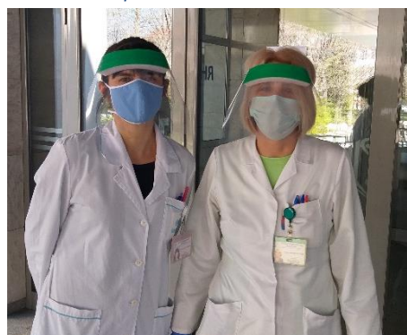
Фиг. 2 Лекари от ВМА получават дарение от прототипните шлемове